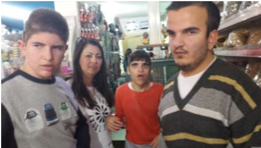
Επίσκεψη σε pet shop