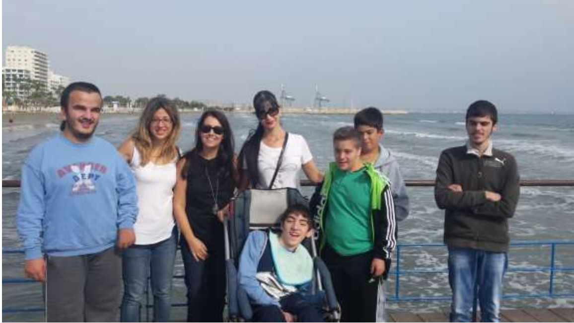
Από την επίσκεψή μας στις Φοινικούδες