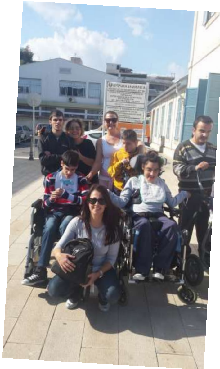
Σε κοινή δραστηριότητα με την ομάδα Η