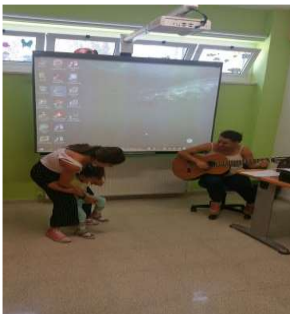
Συνδιδασκαλία μουσικοθεραπεύτριας και δασκάλας. Τραγουδώντας και χορεύοντας μαθαίνουμε τα μέρη του σώματος.