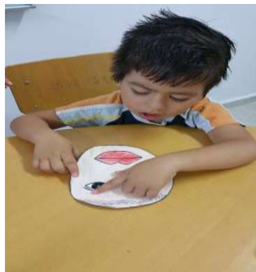
Άσκηση κολλητικής / Εξάσκηση λεπτής κινητικότητας με βάση την θεματική ενότητα το «Σώμα μου»