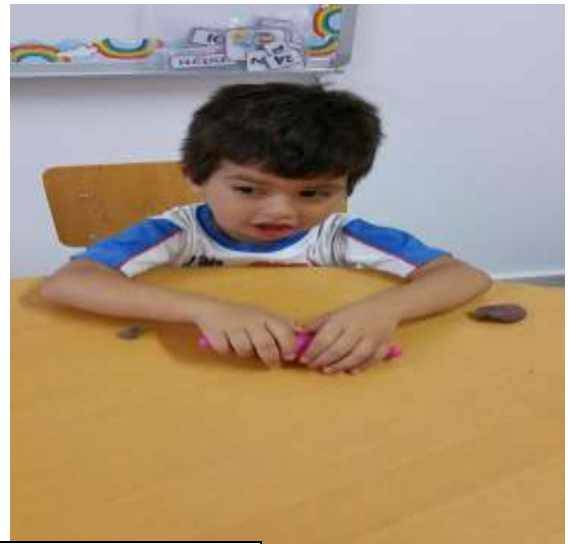
Παιχνίδι επιλογής κάθε παιδιού σε ώρα χαλάρωσης