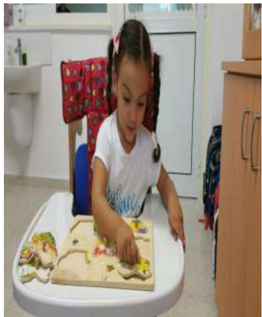
Δεξιότητα συντονισμού ματιού/ χεριού μέσω παιχνιδιών ( πχ. Πάζλ)