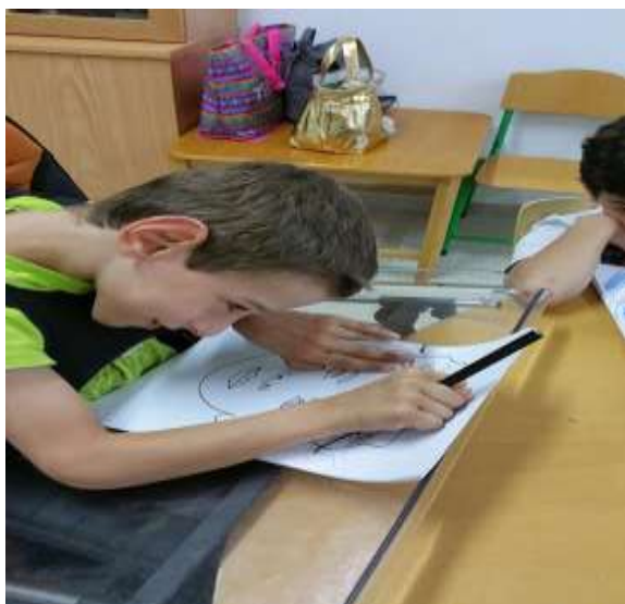
Εξάσκηση γραφής/χρωμάτισμα μέσα σε πλαίσιο για την ενότητα το «Σώμα μου»