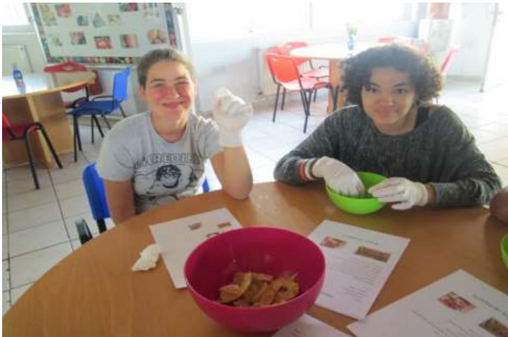
Κατασκευή γλυκού στα πλαίσια του μαθήματος «Αγωγή υγείας»